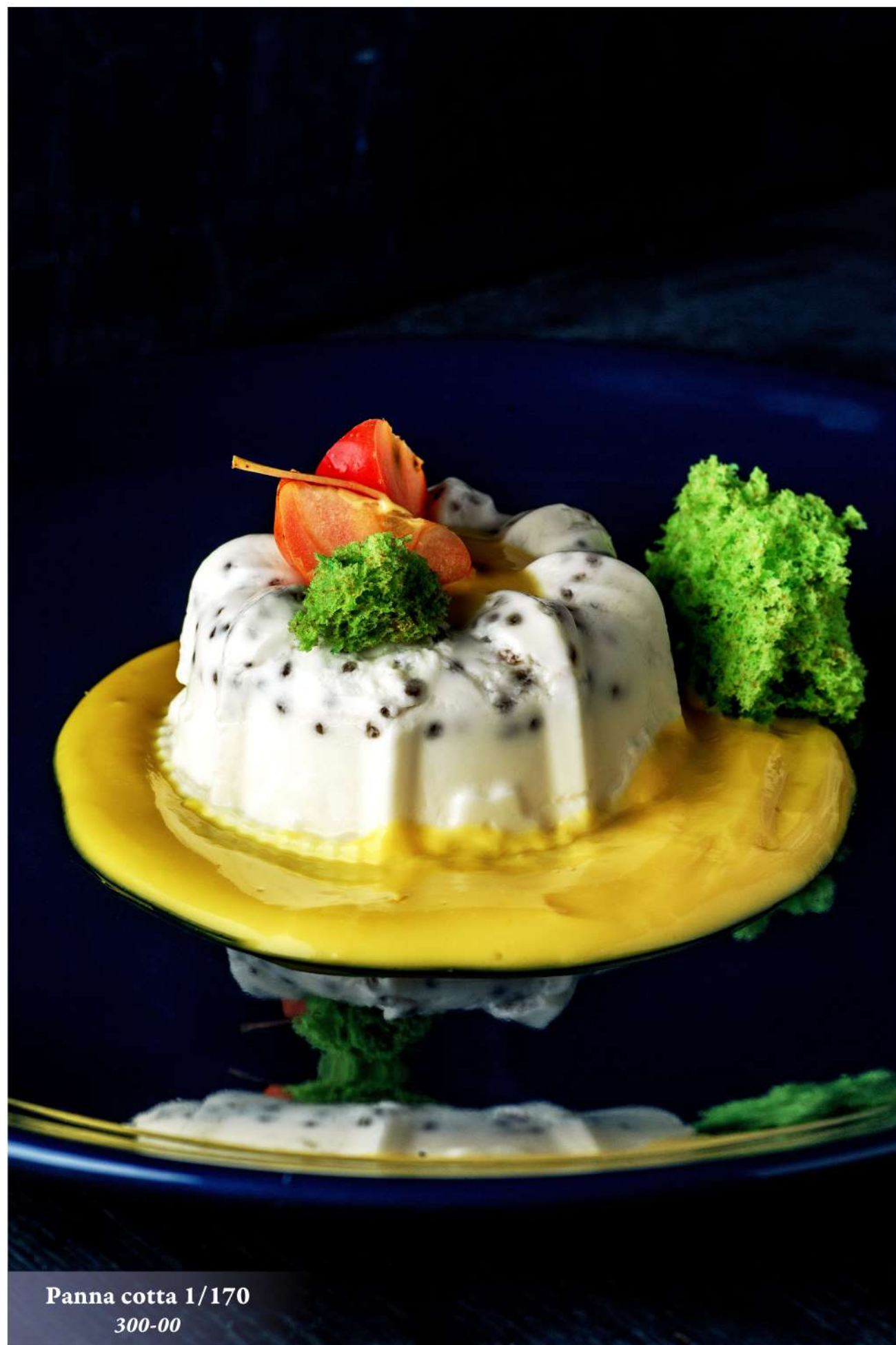
Panna cotta 1/170 300-00